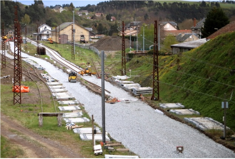
Les traverses en béton et les long rails sont posés sur les abords.