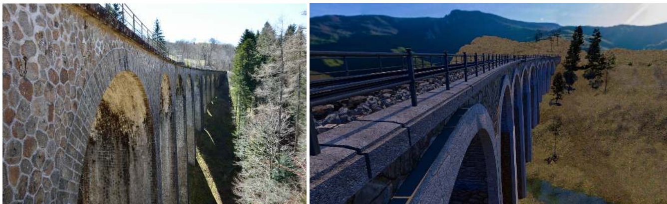
Modélisation 3D du viaduc de Saguissole

Pour l'instant, 28 minutes de film sont déjà montées.