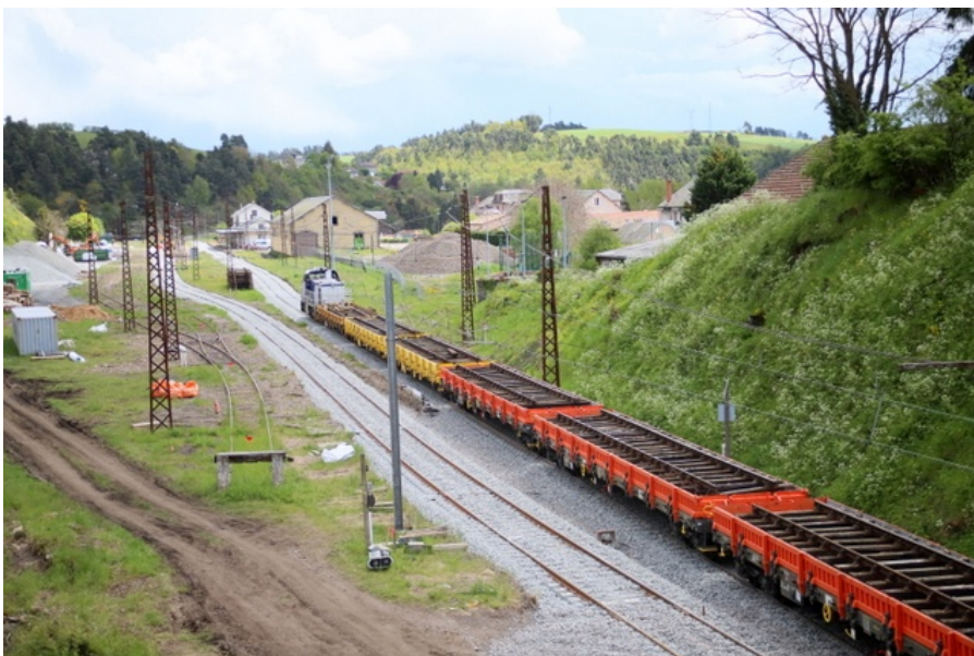
Les trains de travaux acheminent le matériel en attendant le bourrage définitif.