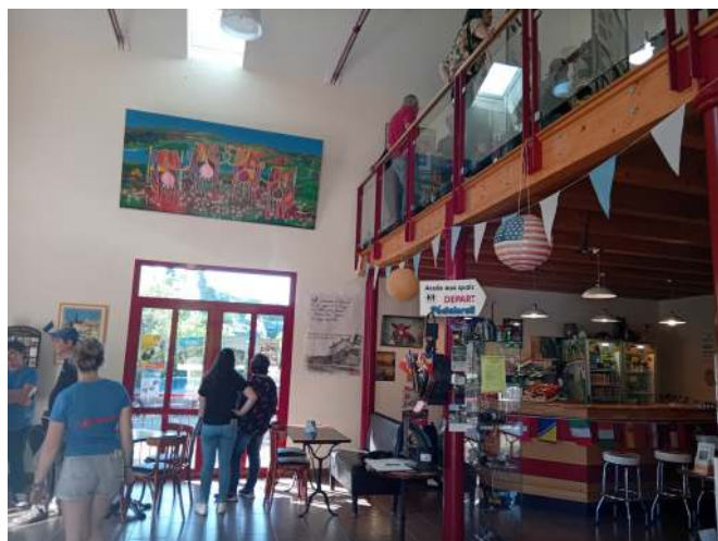
C'est à l'étage qu'a lieu l'exposition et la diffusion du film

Après quoi nous avons partagé le verre de l'amitié au cours duquel plusieurs personnes nous ont sollicités. Parmi elles, des élus pour l'organisation prochaine de projections publiques, et un journaliste du « Réveil Cantalien » pour écrire un article sur notre association et le film. On nous a posé beaucoup de questions sur la ligne et l'histoire du film auxquelles nous avons essayé de répondre le plus justement possible.