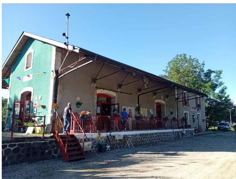
Un cadre sympathique, une ambiance festive.

Si le voyage vous tente, n'hésitez pas à aller sillonner cette ancienne ligne, à l'ombre des arbres, d'ouvrages d'arts en ouvrages d'arts, jusque dans les gorges de la Maronne. Ambiance garantie et accueil fort sympathique.